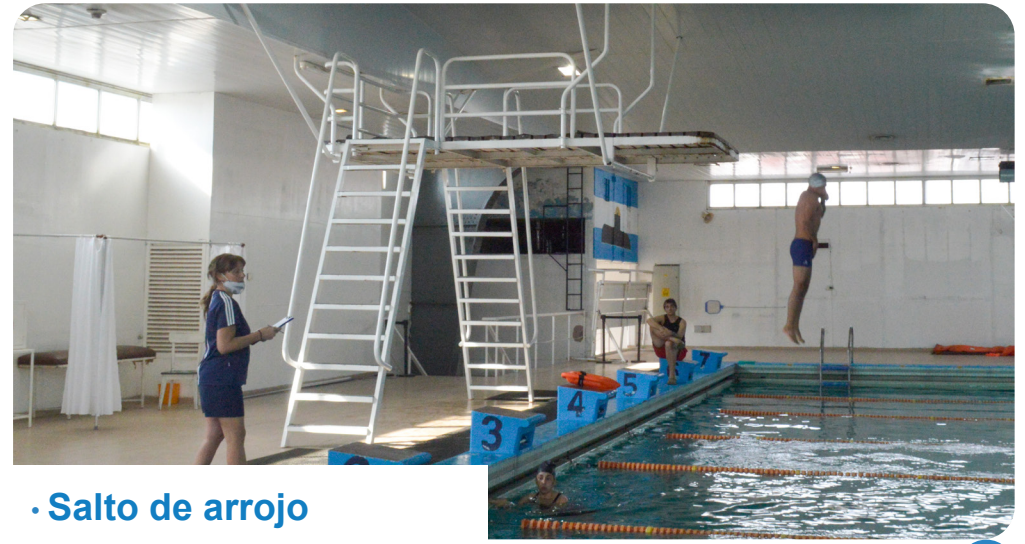
· Salto de arroj