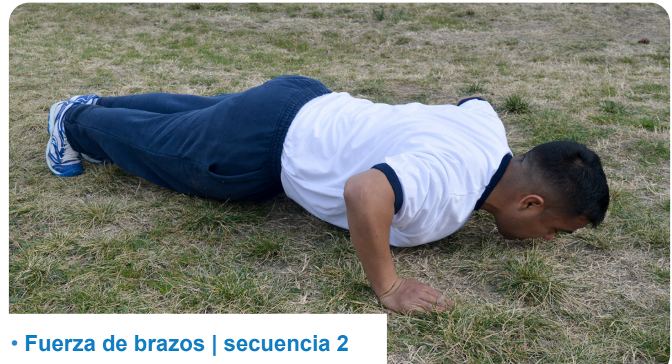
• Fuerza de brazos | secuencia 2