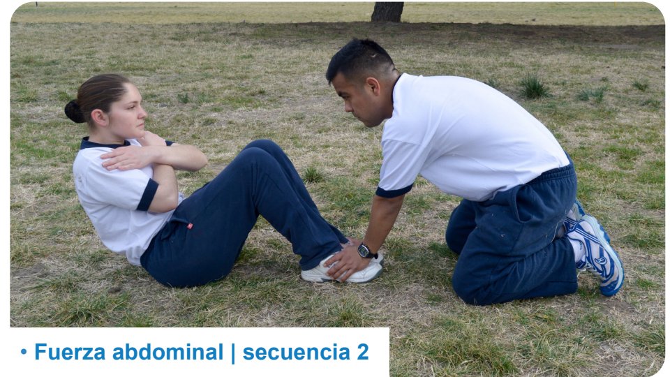
• Fuerza abdominal | secuencia 2