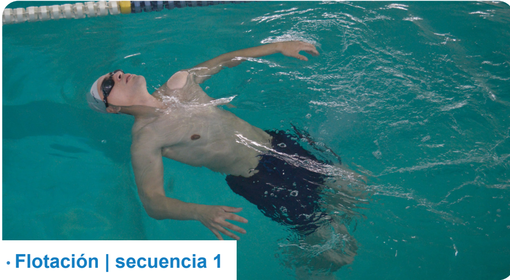
· Flotación | secuencia 1