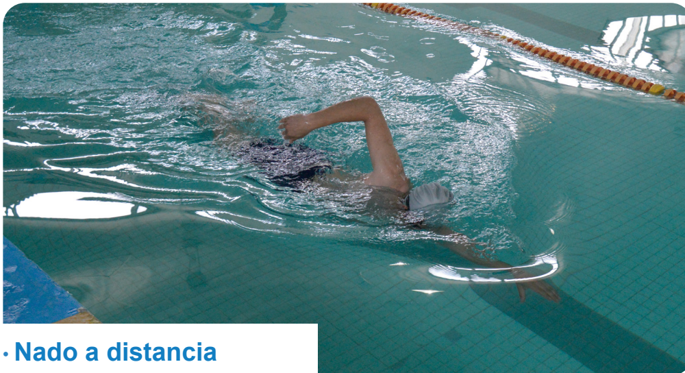
· Nado a distancia