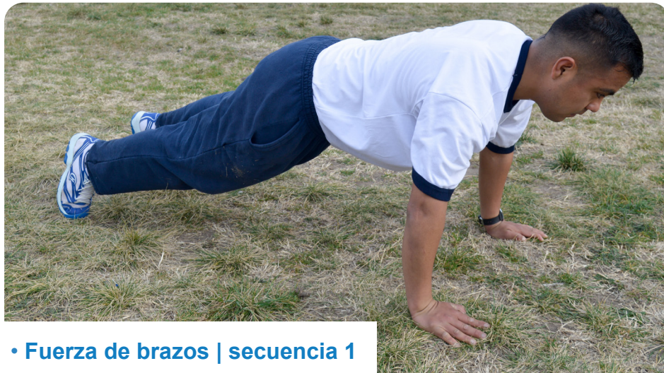
• Fuerza de brazos | secuencia 1