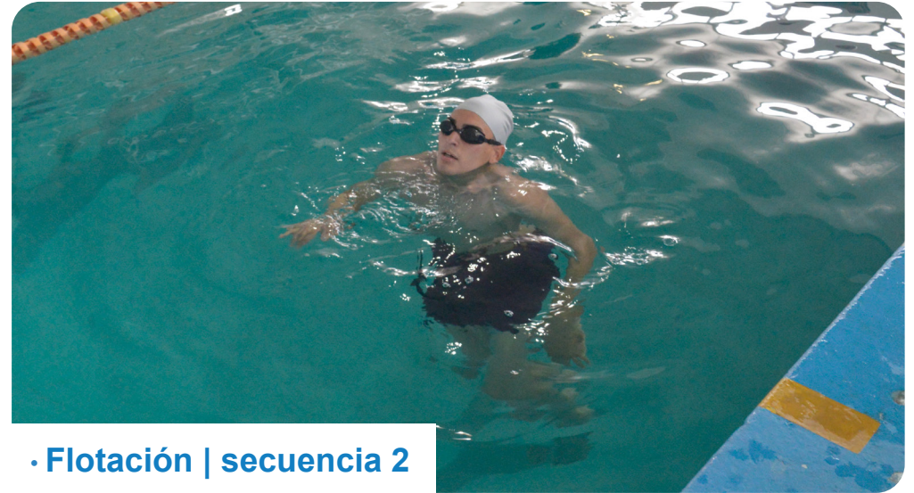
· Flotación | secuencia 2