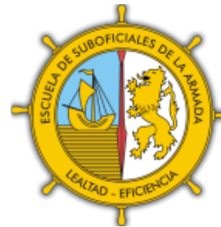
Escuela de Suboficiales