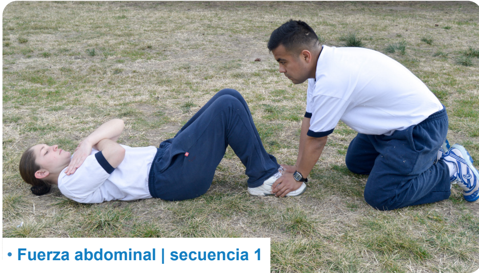
• Fuerza abdominal | secuencia 1